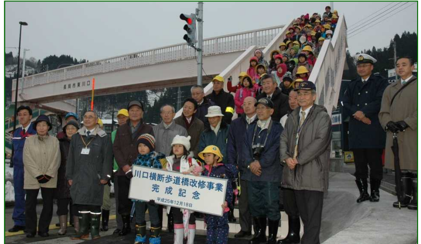
△参加頂いた皆さんで記念写真を撮影しました。