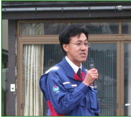
△長岡国道事務所からの挨拶

工事前の川口交差点は、横断歩道橋を渡った後に交通島に取り残される構造となっており、通学児童をはじめ歩行者の安全確保に課題がありました。このたびの延伸工事により危険性が解消されるものと期待されています。 【交通対策課】