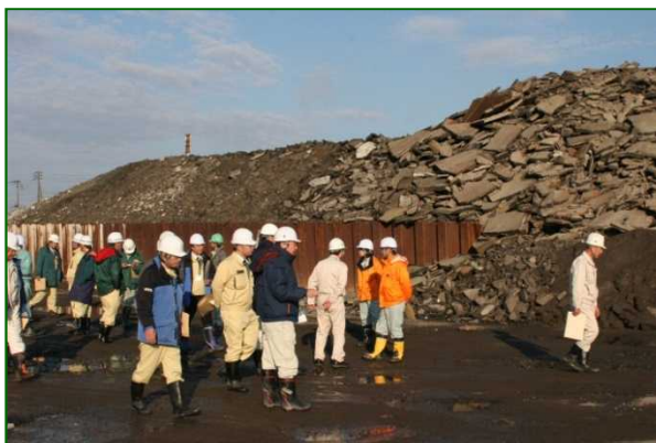
(破碎する前のアスファルト殻)

国・県・地方自治体や関係企業から約20名が参加し、普段、工事に使用している再生アスファルト合材が、どのような手順で作られているかを見学しました。