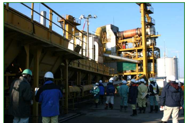
(再生アスファルト合材を生産する施設)

道路の補修や、建物の取り壊しなどで発生したアスファルト殻やコンクリート殻は、破碎、異物除去、選別等の様々な工程を経て、再び、道路の下に敷く路盤材や、再生材使用アスファルトとして、皆さんの周りで再利用されることになります。