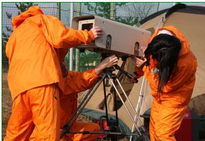
「災害現地班」高感度カメラ設営状況