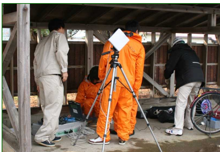
「現地対策本部班」簡易データ転送装置設営状況