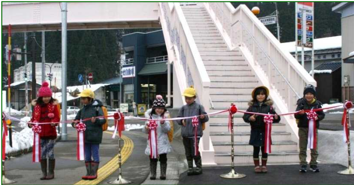
▽児童の皆さんによるテープカット