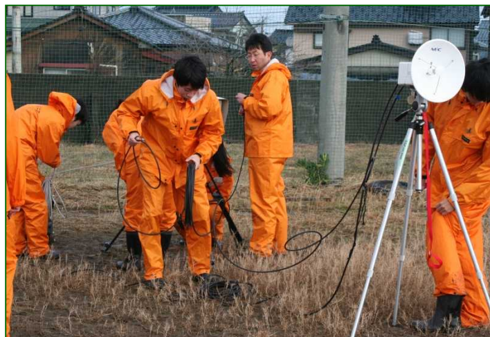
「災害現地班」簡易画像伝送装置設営状況