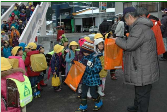
△参加の児童には長岡市から記念品の贈呈がありました。