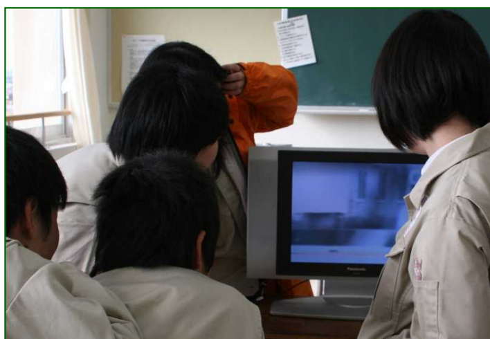
「災害対策本部班」現地画像受信状況