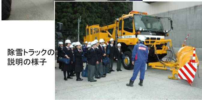
除雪トラックの 説明の様子