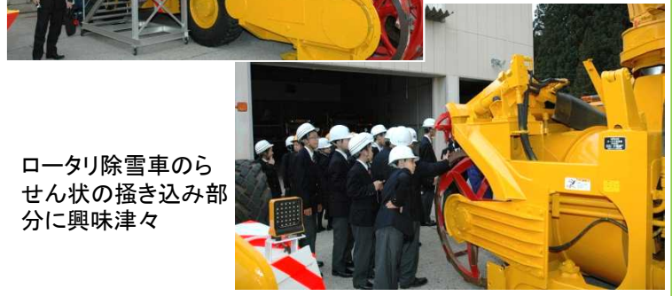
ロータリ除雪車のら せん状の掻き込み部 分に興味津々