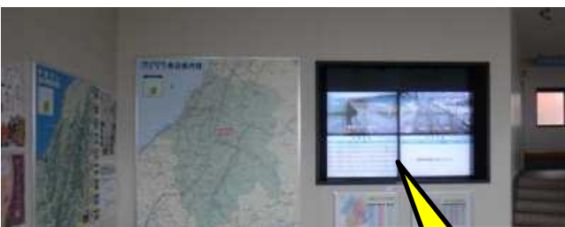
道の駅「ちぢみの里おぢや」 道路情報ターミナル内