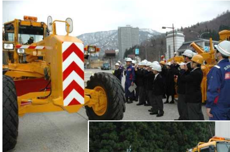
除雪グレーダのデ モンストレーション を間近で見学