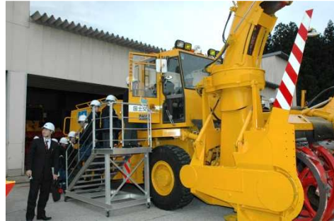
ロータリ除雪車への 体験試乗