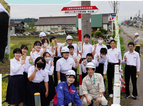
水沢中学生のコメント

私たちの生活が便利になり、十日町市に訪れる人も増えると思います。そんな道路ができると思うと、うれしいです。