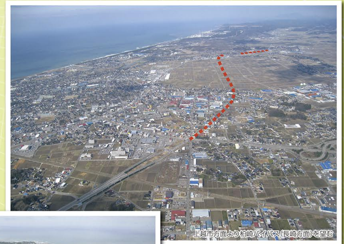
上越市方面より柏崎バイパス(長崎方面)を望む