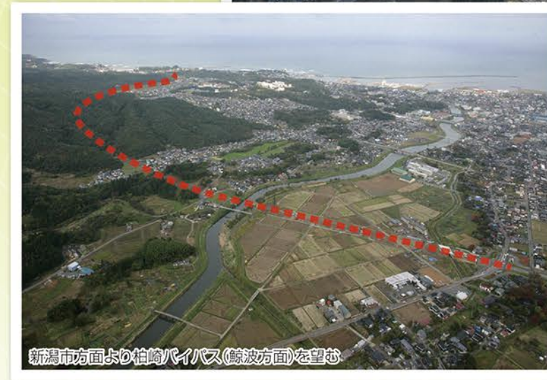
新潟市方面より柏崎バイパス(鯨波方面)を望む