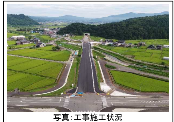
写真：工事施工状況