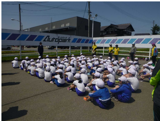
【南魚沼警察署から事故防止の説明】

なお、小出維持出張所管内では、7団体がVSPとして国道17号の美化・清掃活動を行っています。