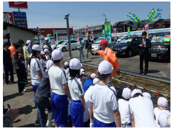
【ひまわりの会から花植えの説明】