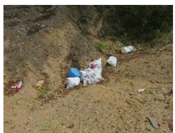
▲千曲川 左岸52.5k付近(6月26日)