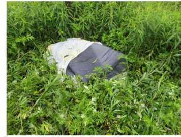
▲千曲川 左岸29.0k付近(5月29日)