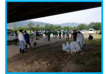
▲市民による一斉清掃の様子 (千曲市千本柳地先)