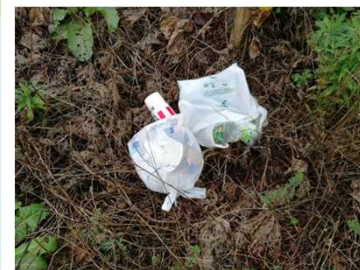
▲千曲川 右岸32.0k付近(9月28日)

このマップの範囲で不法投棄を見た、捨てられている場所がある等の情報がありましたら、連絡をお願いします。 連絡先:国土交通省 千曲川河川事務所 中野出張所 ☎0269(22)2729