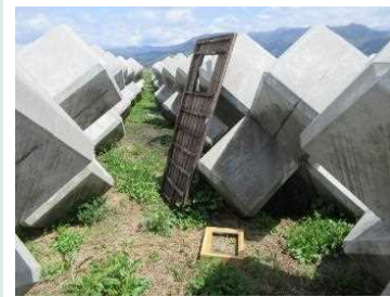
▲千曲川 右岸32.0k付近(4月19日)