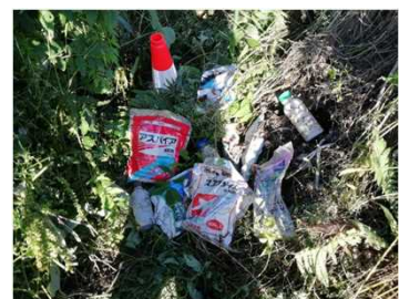
▲千曲川 右岸39.0k付近(6月19日)