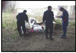
▲▼警察による現場捜査状況