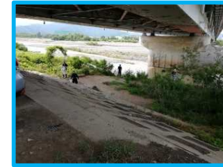
▲芹田地区の皆様による清掃の様子 (長野市川合新田地先)