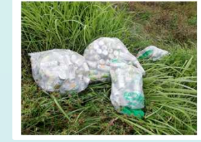
▲ 犀川右岸3.75k付近(8月16日)