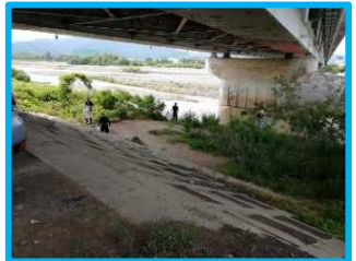
▲ 芦田地区の皆様による清掃の様子 (長野市川合新田地先)

河川敷に家庭からと思われるゴミを置いていく人が後を絶ちません。誰がそれを処理するのでしょうか？ゴミを分別するのが面倒なのでしょうか？近のゴミステーションに出す方がわざわざ川に捨てるより簡単で、気持ちも良いと思います。このような心ない人の後片付けに税金が使われてしまいます。進んでゴミ拾いをするボランティアの人たちもいます。皆さんの“ちょっとしたやさしい気持ち”の積み重ねが大切だと思います。