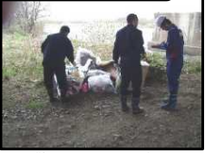
▲ 警察による現場捜査状況

● 廃棄物処理法 5年以下の懲役 もしくは 1000万円以下の罰金 またはこの両方