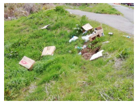
▲ 千曲川右岸69.75k付近(4月17日)

◎ 千曲川・犀川には位置を示すため、それぞれの下流端を起点とする距離標が設置してあります。また、上流から下流を見て左右をそれぞれ左岸・右岸と言います。