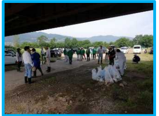
▲ 市民による一斉清掃の様子 (千曲市千本柳地先)