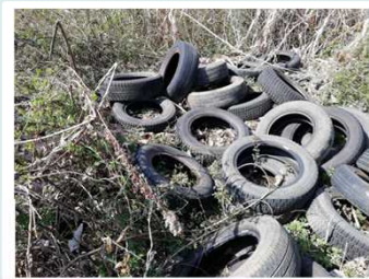
▲梓川 左岸80.25k付近(4月4日)