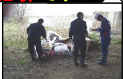
▲▼警察による現場捜査状況