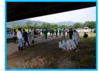
▲市民による一斉清掃の様子 (千曲市千本柳地先)