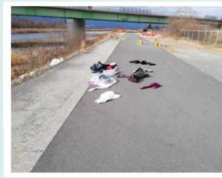
▲梓川 左岸64.0k付近(12月11日)