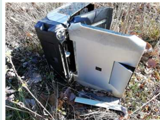
▲梓川 右岸77.75k付近(11月21日)