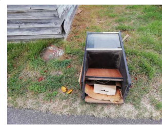
▲梓川 左岸76.75k付近(9月22日)

◎犀川には位置を示すため、犀川・千曲川を起点とする距離標が設置してあります。また、上流から下流を見て左右をそれぞれ左岸・右岸と言います。