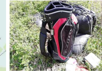
▼梓川 左岸63.75k付近(4月16日)