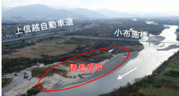
現在の状況（代表として小布施町の場合）