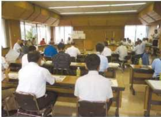
上田市千曲川×依田川 かわまちづくり協議会の様子

計画の策定にあたり学識者、国、県、上田市や、地元自治会、各種団体などの利用者から構成される「上田市 千曲川×依田川かわまちづくり協議会」で広く意見を交換し、かわまちづくり計画を作成してきました。