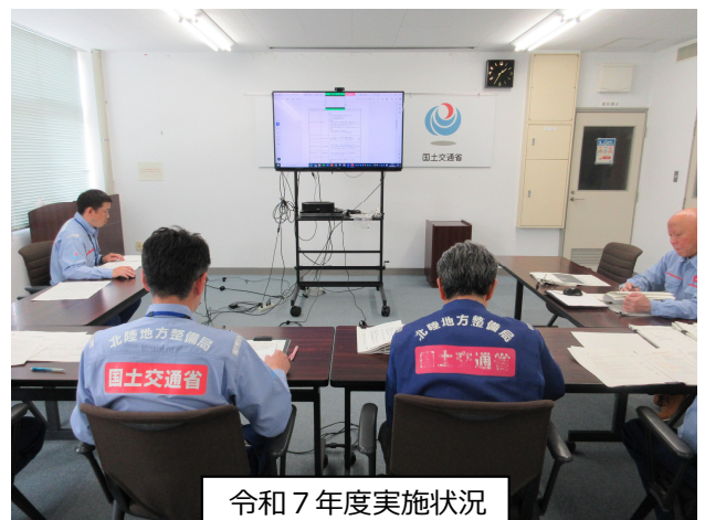
令和7年度実施状況