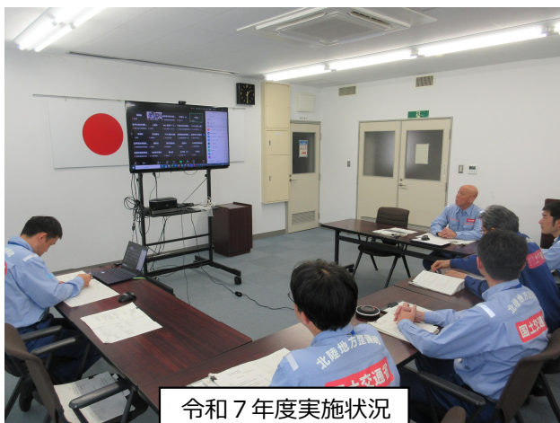
令和7年度実施状況