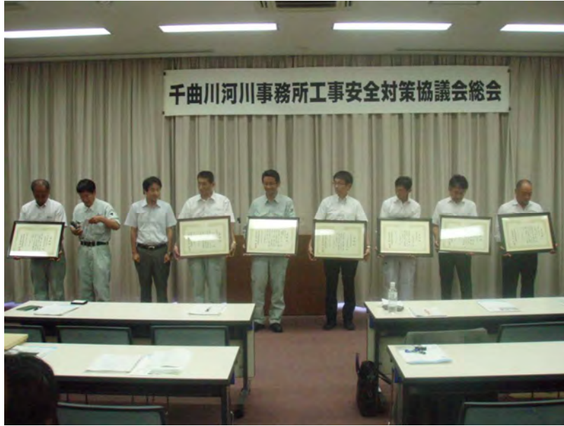
表彰を受けられた皆様

優良工事事務所長表彰の飯島建設(株)の「千曲川管内樋門等補修工事」は広範囲に点在する18箇所施設の施設を対象に、多岐に渡る補修工法が必要な工事に対し、入念な事前調査を実施した上で、適切な施工計画を設定し、工期内で高品質な施工を無事実施している。また、工事の際に各種の創意工夫を行い、コスト縮減や工期短縮に努めたことが評価されました。