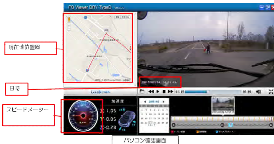
ドライブレコーダ