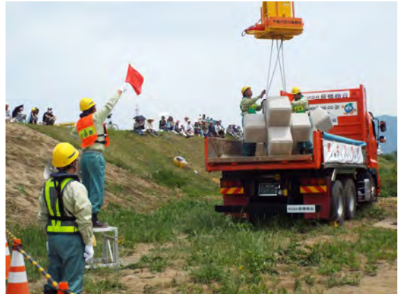
水防演習のブロック投入工法