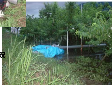
H18.7月出水時の水防活動状況