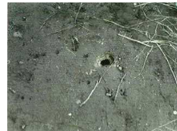
減水後の現地状況