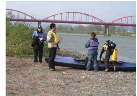
水際 (カヌー) の様子