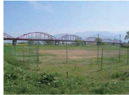
グラウンドの様子