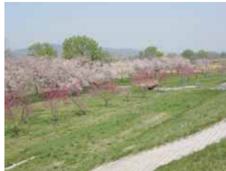
桜・桃の開花の様子