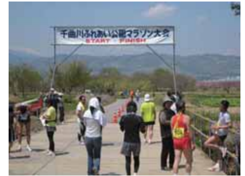
千曲川ふれあい公園マラソン