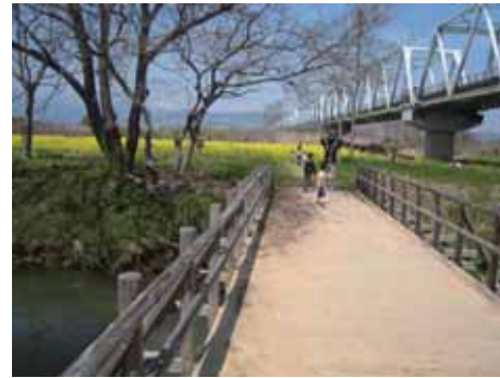
菜の花の開花の様子