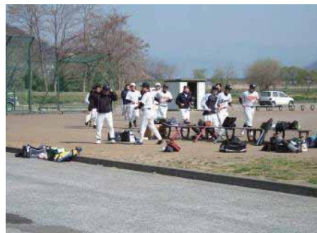
グラウンド (野球) の様子