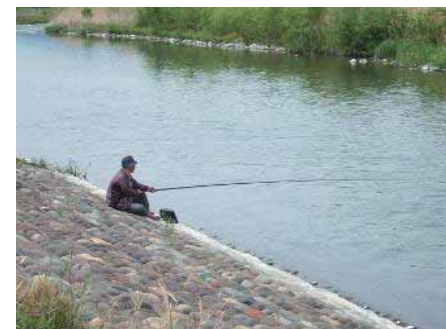
水際 (釣り) の様子