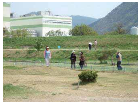
マレットゴルフ場の様子