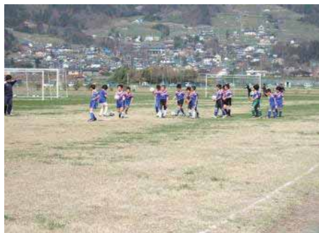
グラウンド (サッカー) の様子