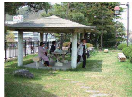
東屋 (休憩) の様子