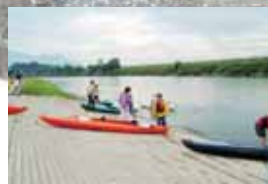
柏尾橋カヌーボート