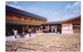
道の駅「千曲川」 (周辺施設)