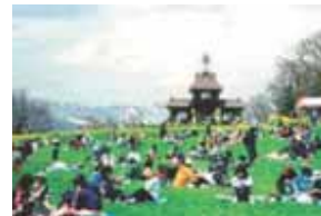
菜の花公園 (周辺施設)