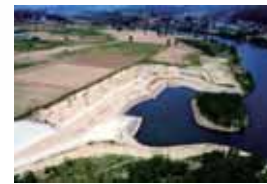
常盤自然観察広場 (ワント)