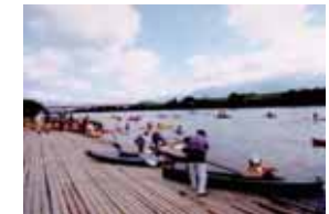
飯山橋カヌーボート