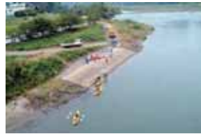
湯滝橋カヌーボート