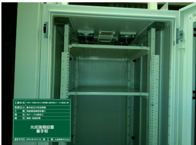
光成端箱 接続 着手前

・新設自営柱設置(3箇所)／橋梁配管(2箇所)／トンネル支持金物設置(2箇所) 完了 光ケーブルの敷設作業 (8,520m) 及び光ケーブルの接続作業 (12箇所) 完了 現在、追加機器の製造を実施しております