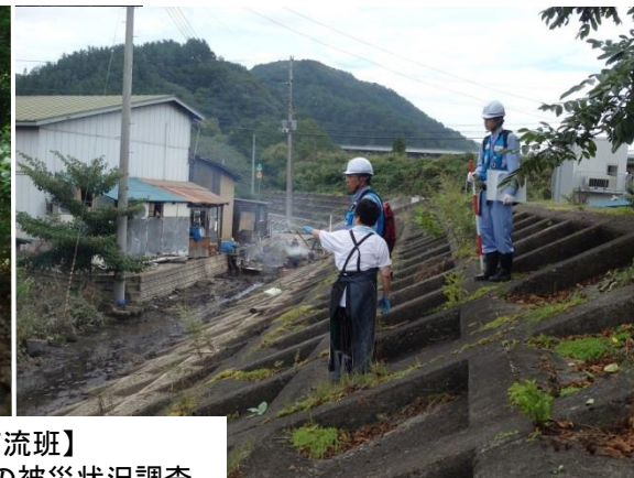
【信濃川下流班】 村道芦生茂市線等の被災状況調査