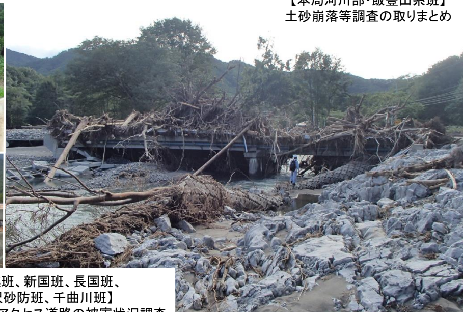
【本局河川部・飯豊山系班】 土砂崩落等調査の取りまとめ