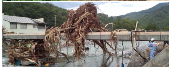
【本局道路部・羽越班、新国班、長国班、 本局用地部・湯沢砂防班、千曲川班】 安家地区の孤立集落へのアクセス道路の被害状況調査