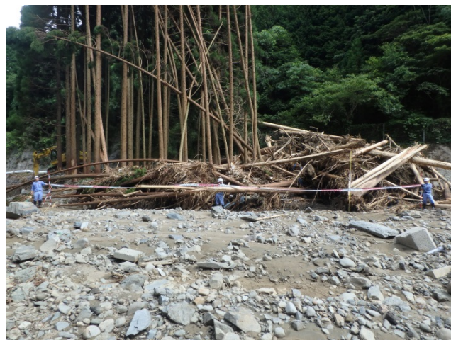
▲7月17日 朝倉市疣目川流域 流木調査 【砂防第2班】