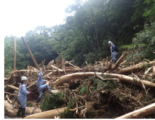
▲7月17日 朝倉市疣目川流域 流木調査 【砂防第2班】