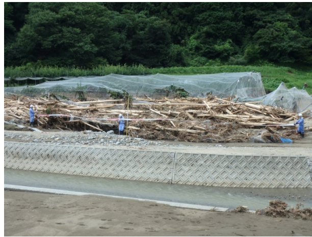
▲7月17日 朝倉市黒川流域 流木調査 【砂防第1班】