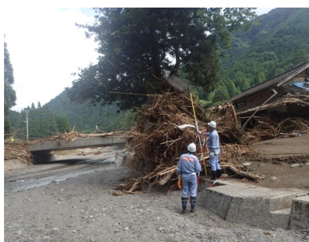
▲7月17日 朝倉市疣目川流域 流木調査 【砂防第2班】