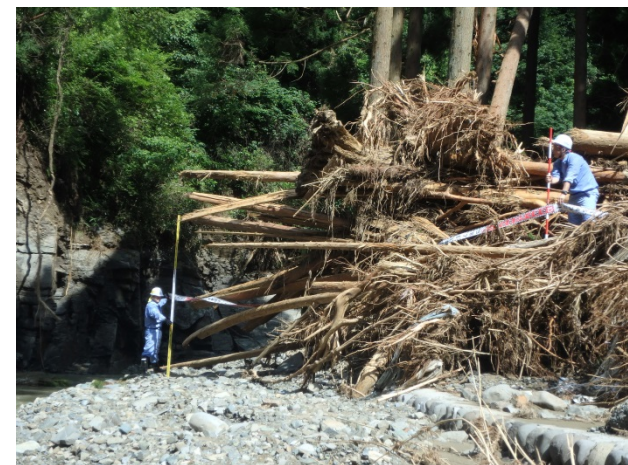
▲7月17日 朝倉市黒川流域 流木調査 【砂防第1班】

■北陸地方整備局では、流木が著しい福岡県朝倉市(黒川、疣目川流域)において、災害申請資料作成支援のため流木状況調査を実施しています。【現地活動は2班(本局、立山砂防)】