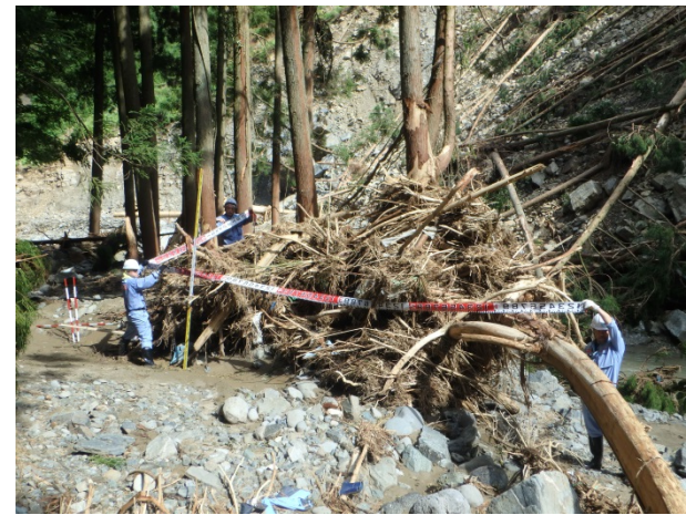
▲7月17日 朝倉市黒川流域 流木調査 【砂防第1班】