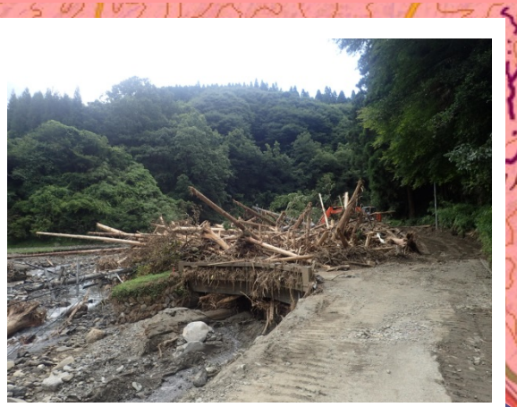
▲7月17日 朝倉市疣目川流域 流木状況