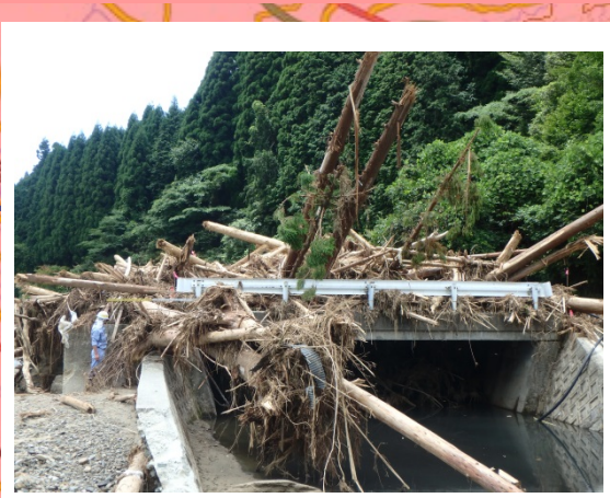
▲7月17日 朝倉市黒川流域 流木状況

◆調査区域の朝倉市朝倉地域に、13時35分土砂災害警戒のため、避難指示が発令され、安全確保のため速やかに退避しました。