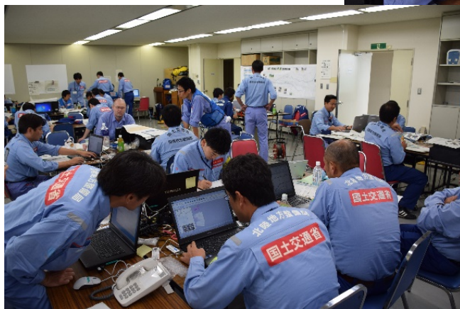
報告様式作成状況