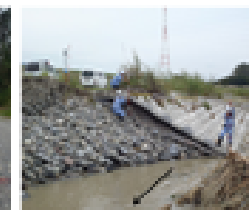
被災状況報告様式