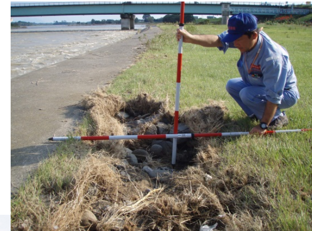
宇都宮市下岡本町地先