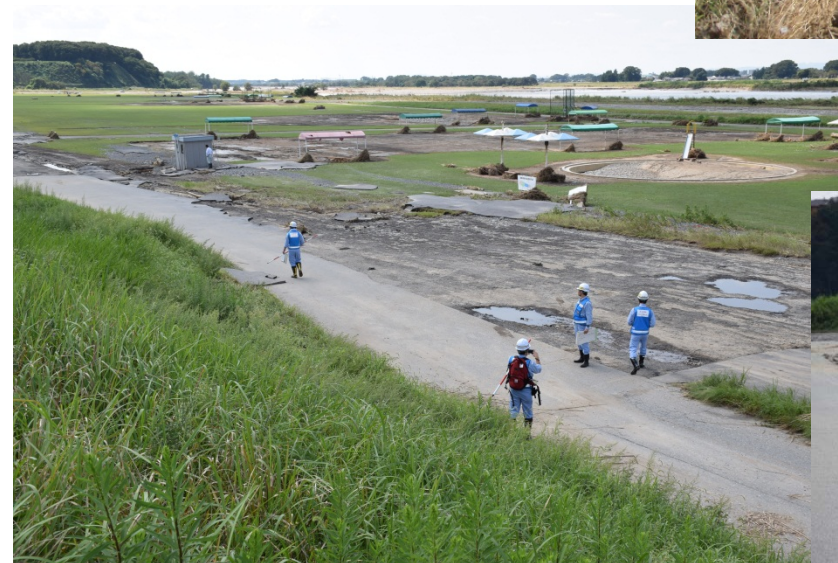
宇都宮市道場宿地先