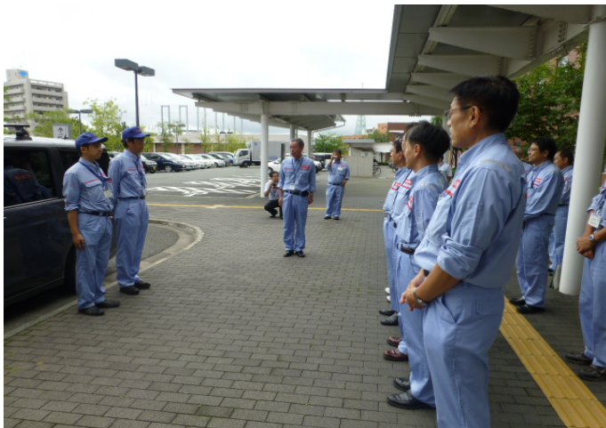
9月10日(木) リエゾン班(2名) 出発

北陸地方整備局は、台風18号から変わった低気圧による出水に対する支援を実施するため、福島県南会津町へTEC-FORCE(緊急災害対策派遣隊)1班2名を派遣し、2日間、リエゾン※として情報収集にあたりました。 ※フランス語で「つなぐ」の意味で、被災自治体で情報の収集・提供を行う。