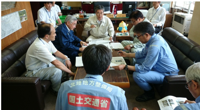
岩城光英参議院議員、菅家一郎衆議院議員が来庁