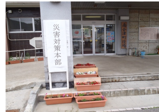
南会津町役場 災害対策本部設置