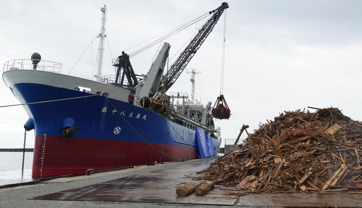
宇出津港(石川県能登町)