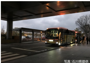
県庁を出発するボランティアバス