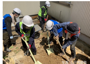
ボランティアの活動状況