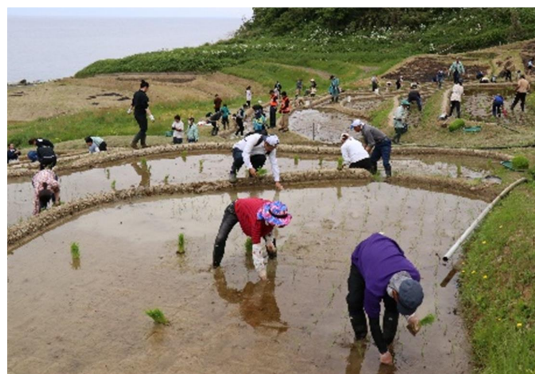
棚田の再建状況