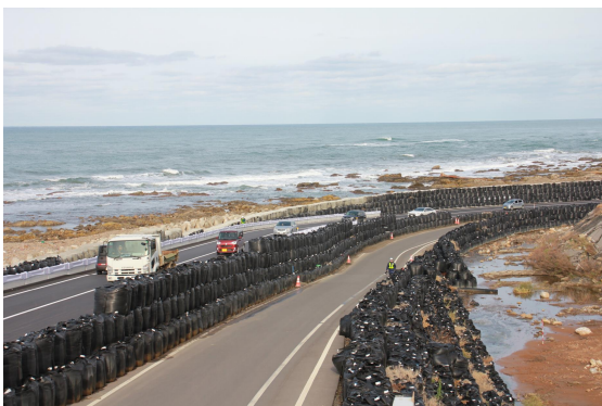
隆起海岸に設置した仮設道路