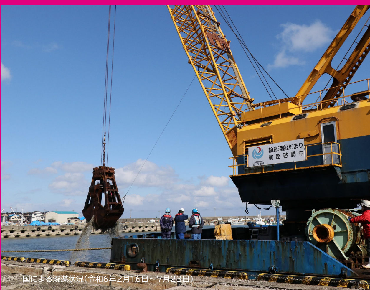
国による浚渫状況(令和6年2月16日～7月23日)