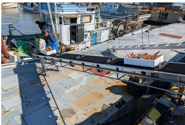
地域の生業であるカニ漁の再開(令和6年11月8日)