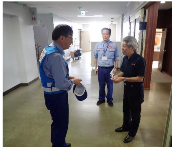
珠洲市長との面会