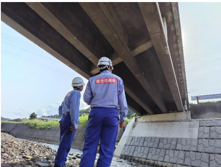
被災状況調査(輪島市)