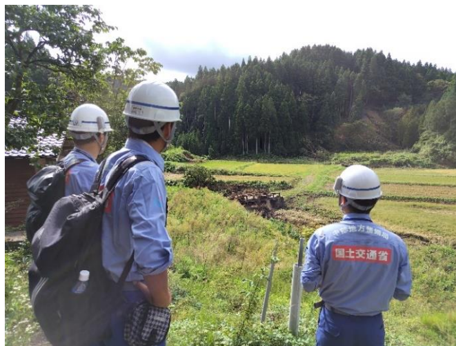
被災状況調査(輪島市 滝又川)