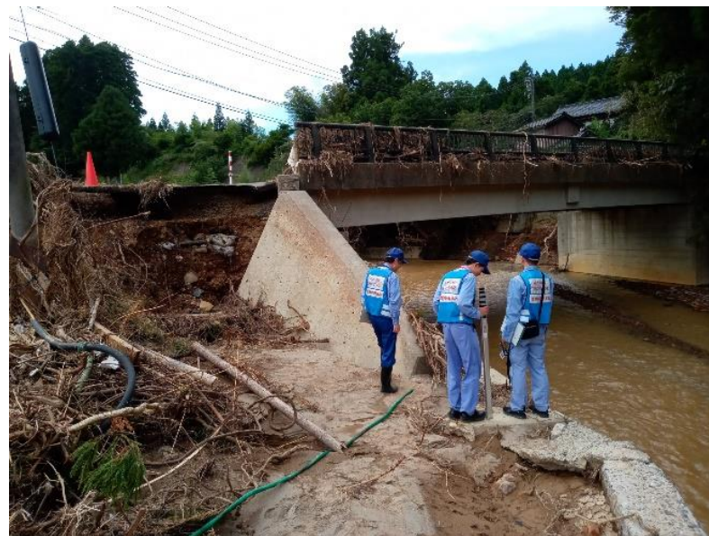
被災状況調査(珠洲市)