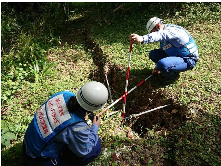
被災状況調査(珠洲市)