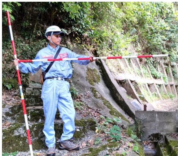
被災状況調査(穴水町)