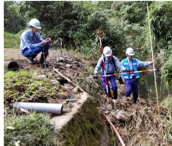
被災状況調査(能登町本木川)