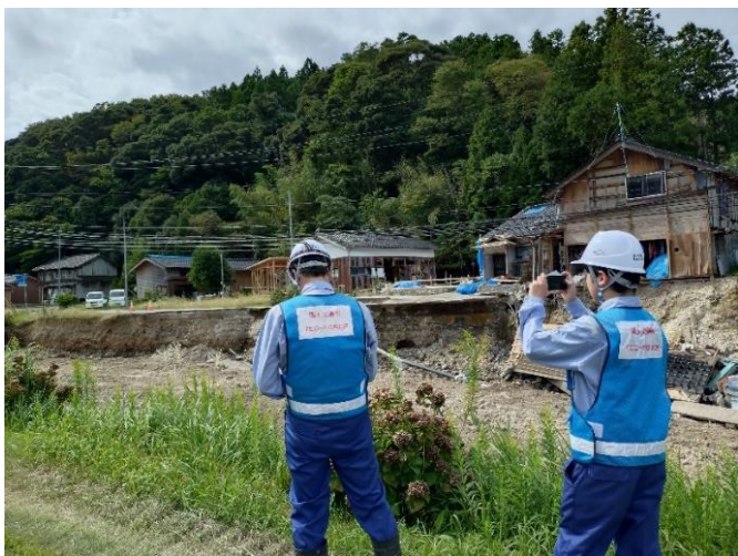
被災状況調査(珠洲市 珠洲大谷川)