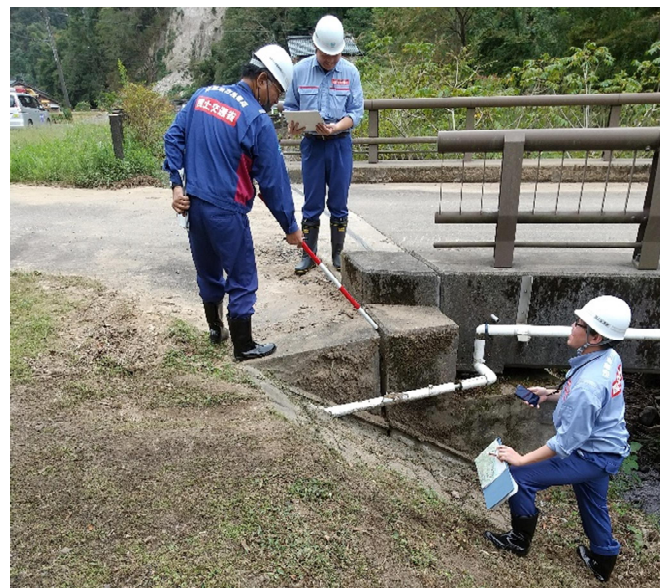
被災状況調査(能登町)