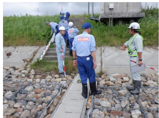
過年度の点検状況