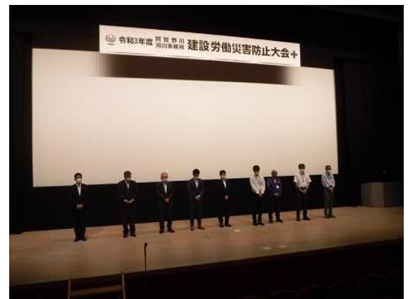
昨年度の建設労働災害防止大会