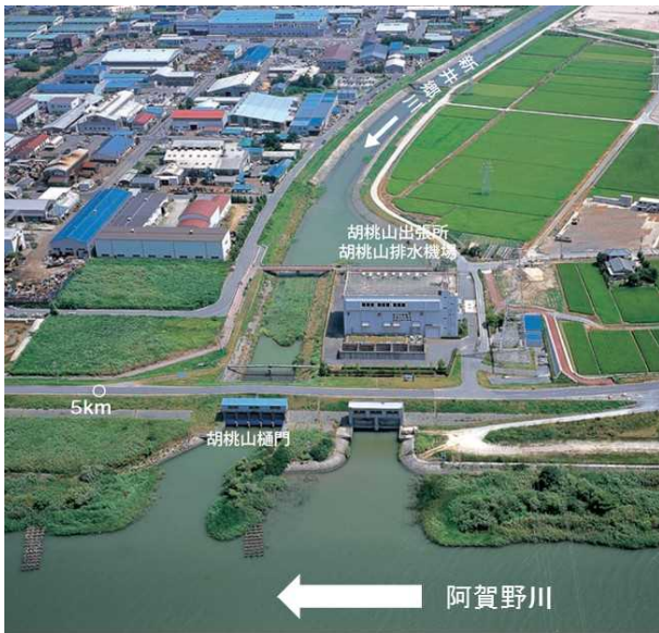
胡桃山排水機場 (阿賀野川河川事務所・胡桃山出張所)