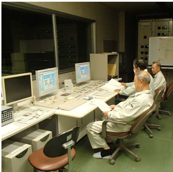
操作員運転状況 (7月28日未明)