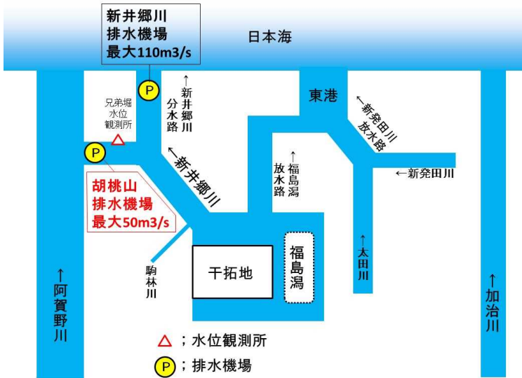
阿賀北地域の河川と排水機場