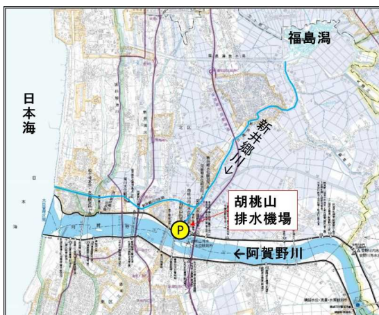
胡桃山排水機場位置図