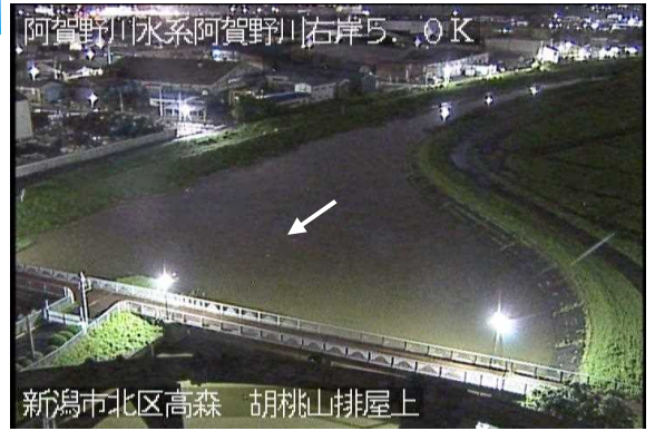
胡桃山排水機場に続く新井郷川の状況 (7月28日 22時 撮影)