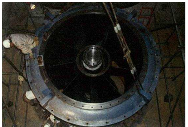
排水ポンプの内部構造 (建設時の状況)