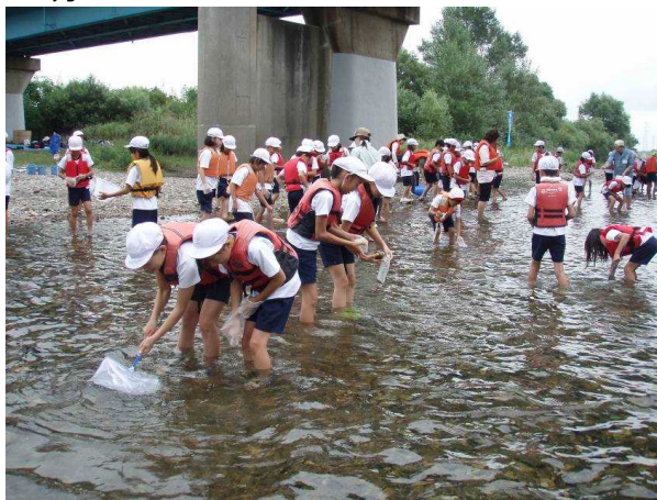
水生生物調査 実施の様子

学校に比較的近い早出川の河川敷で、 濁度(COD)・pHの測定や、生息して いる生物の調査を行います。