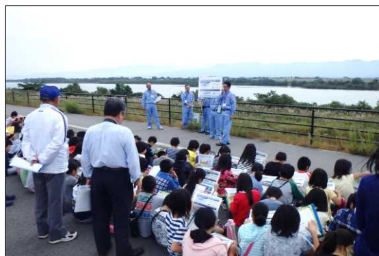
写真上下：昨年の横越小学校での出前授業の様子

阿賀野川の概要や歴史、自然再生事業など、地域における川の役割について現地で学びます。 また、満願寺では阿賀野川と小阿賀野川の水位の違いを、実際に舟を通してその様子を見てもらい、満願寺閘門の役割を学習します。