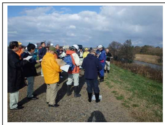
昨年11月に実施した共同点検の様子