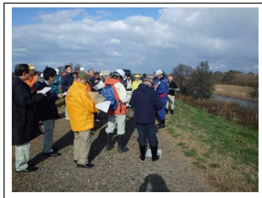
昨年11月に実施した共同点検の様子