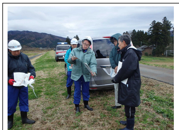
11月26日の五泉市管内共同点検の様子