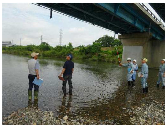
（昨年度点検時の状況；善願橋）