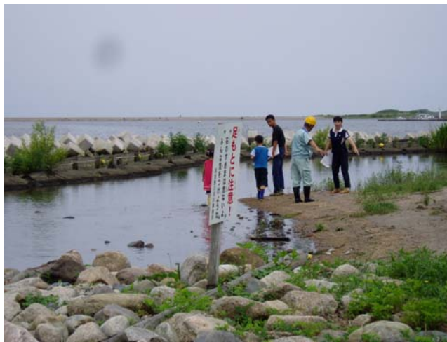
＜松浜水辺の楽校での点検風景＞