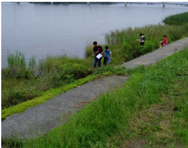
＜阿賀野川公園での点検風景＞

■一般の参加者につきましては、公募等により募集し、参加して頂いたのべ146人の方々により、実際に現地で点検を行いました。