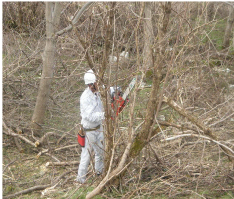
平成 21 年度の伐採状況