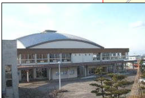
新津地区市民会館