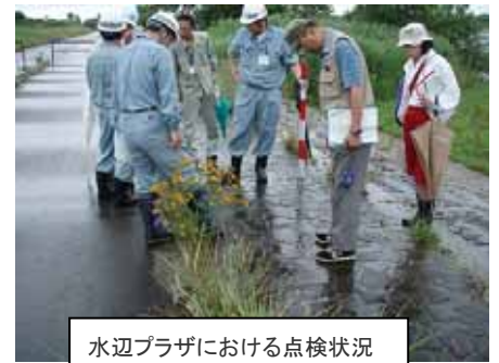
水辺プラザにおける点検状況