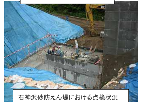
石神沢砂防えん堤における点検状況