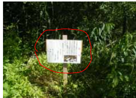
看板設置位置(新潟市江南区小杉地先)