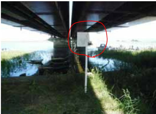
看板(係留施設等あるもの)設置位置 (新潟市東区津島屋地先)