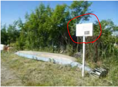
看板設置位置(新潟市東区津島屋地先)