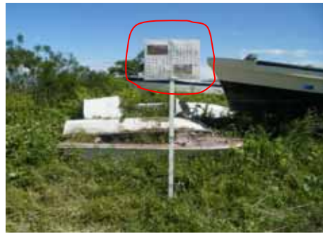
看板設置位置(新潟市東区津島屋地先)