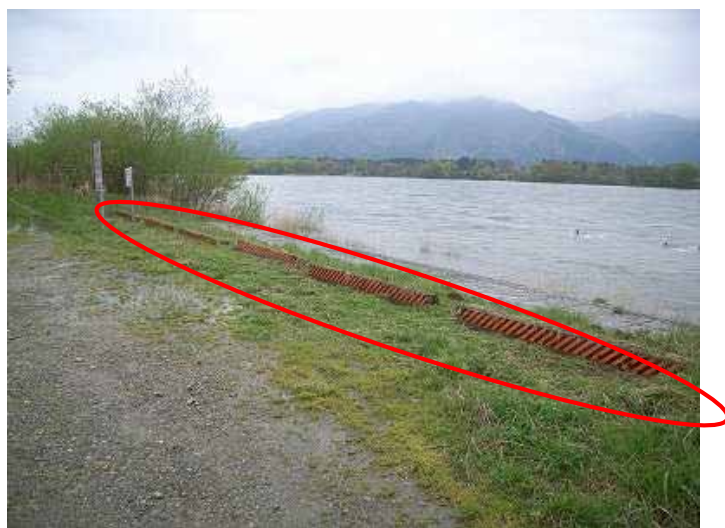
措置後：車止めブロックが確認できるよう除草を実施

※ 今回の点検で問題なしの箇所についても、現地状況は天候その他により日々変わります。危険箇所には近づかないことは勿論のこと、危険表示が無い箇所や施設整備がなされた箇所であっても、利用者自らが安全を確認の上、ご利用いただきますようお願いいたします。