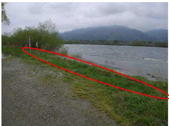
措置前：車止めブロックが草により確認しにくい