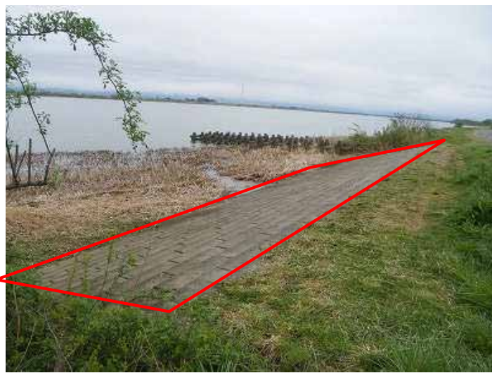
措置後：安全に親水護岸を利用出来るよう堆積土除去及び除草を実施