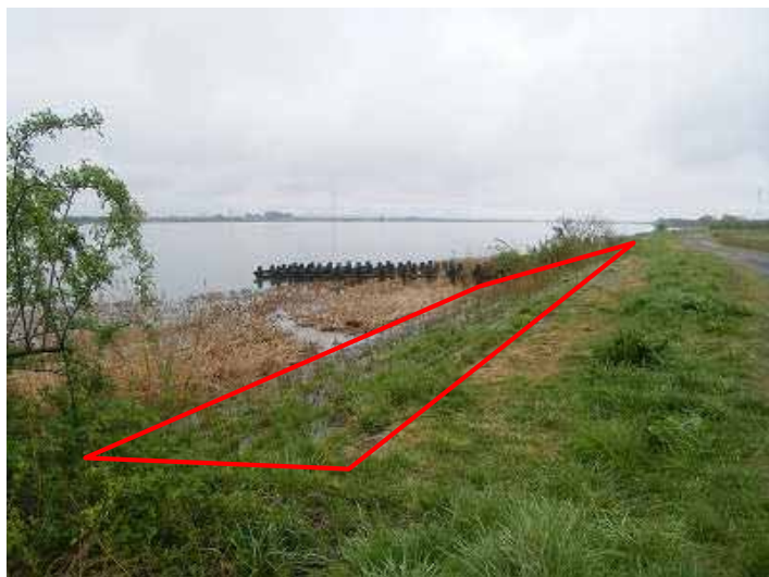
措置前：階段部に土砂が堆積し草が繁茂しており親水護岸利用に支障