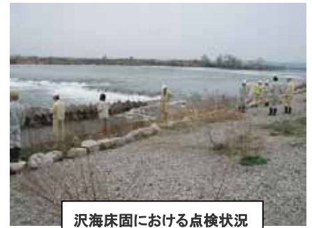
沢海床固における点検状況