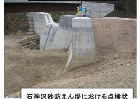
石神沢砂防えん堤における点検状況