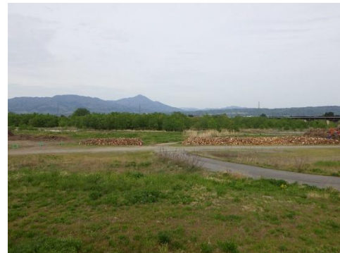
配布予定の伐採木