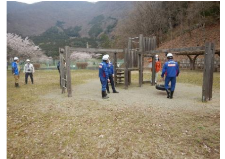
（大川ダム管内若郷湖東公園）