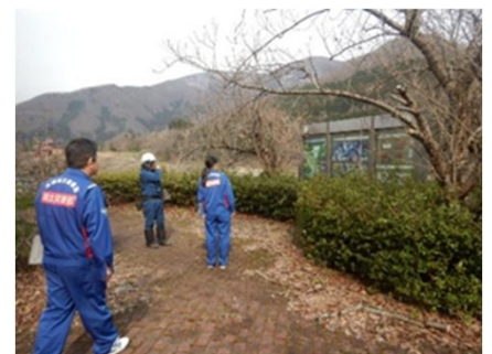
令和7年度の点検状況 （大川ダム管内若郷湖西公園）