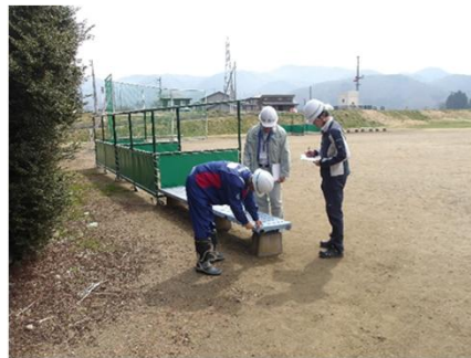
令和7年度の点検状況 （会津若松市大川緑地公園）