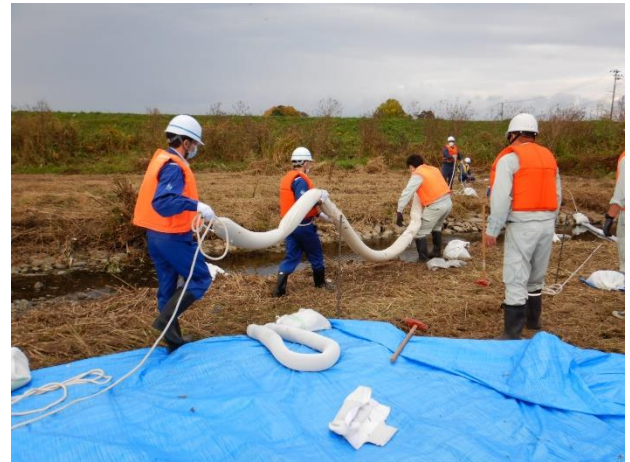
過去の訓練の様子

※ 取材にお越しになる場合は11月27日（水）17時までに下記「お問い合わせ先」までご一報いただきますようご協力をお願いします。