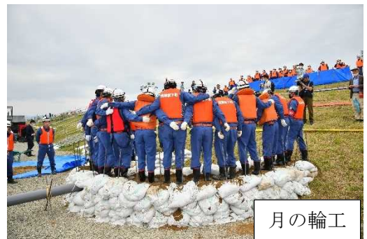
令和5年度総合水防演習の実施状況